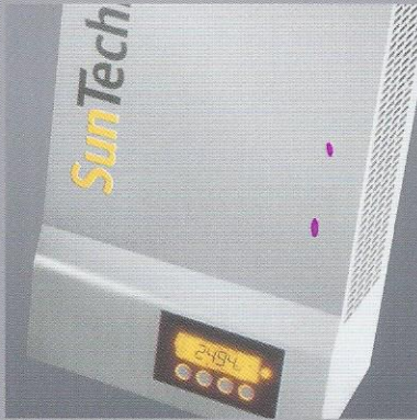
Das elegante Designergehäuse aus Aluminium umschließt innovative Technik