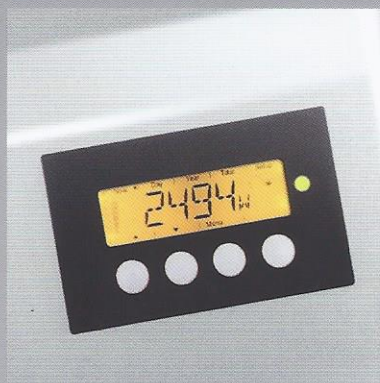
Über das Display können Sie auf alle wesentlichen Daten der PV-Anlage zugreifen