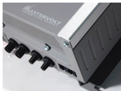
MultiContact Stecker und RS485 Datenbus Kommunikation.